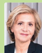
Valérie PECRESSE Présidente du Conseil Régional d'Île-de-France